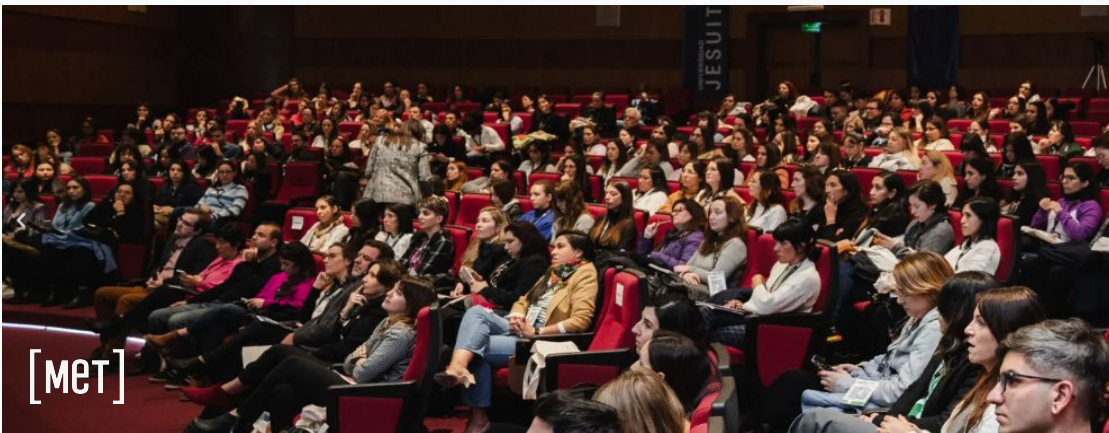
Women in Data Science Worldwide, 2023.

El Beyond Tech Summit es un espacio curado, no masivo.